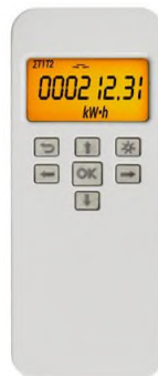
Рисунок 4 – Общий вид дистанционного индикаторного устройства