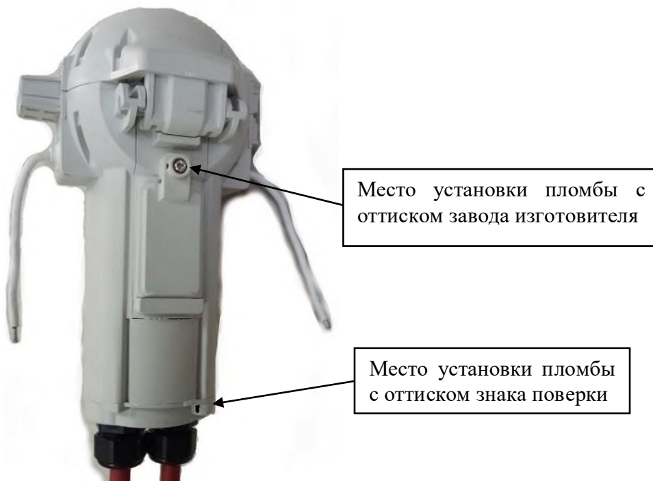
Рисунок 1 – Общий вид БИ 1 и БИ 2 ВПУ в корпусе типа SPHV1 RGC2, RGC3