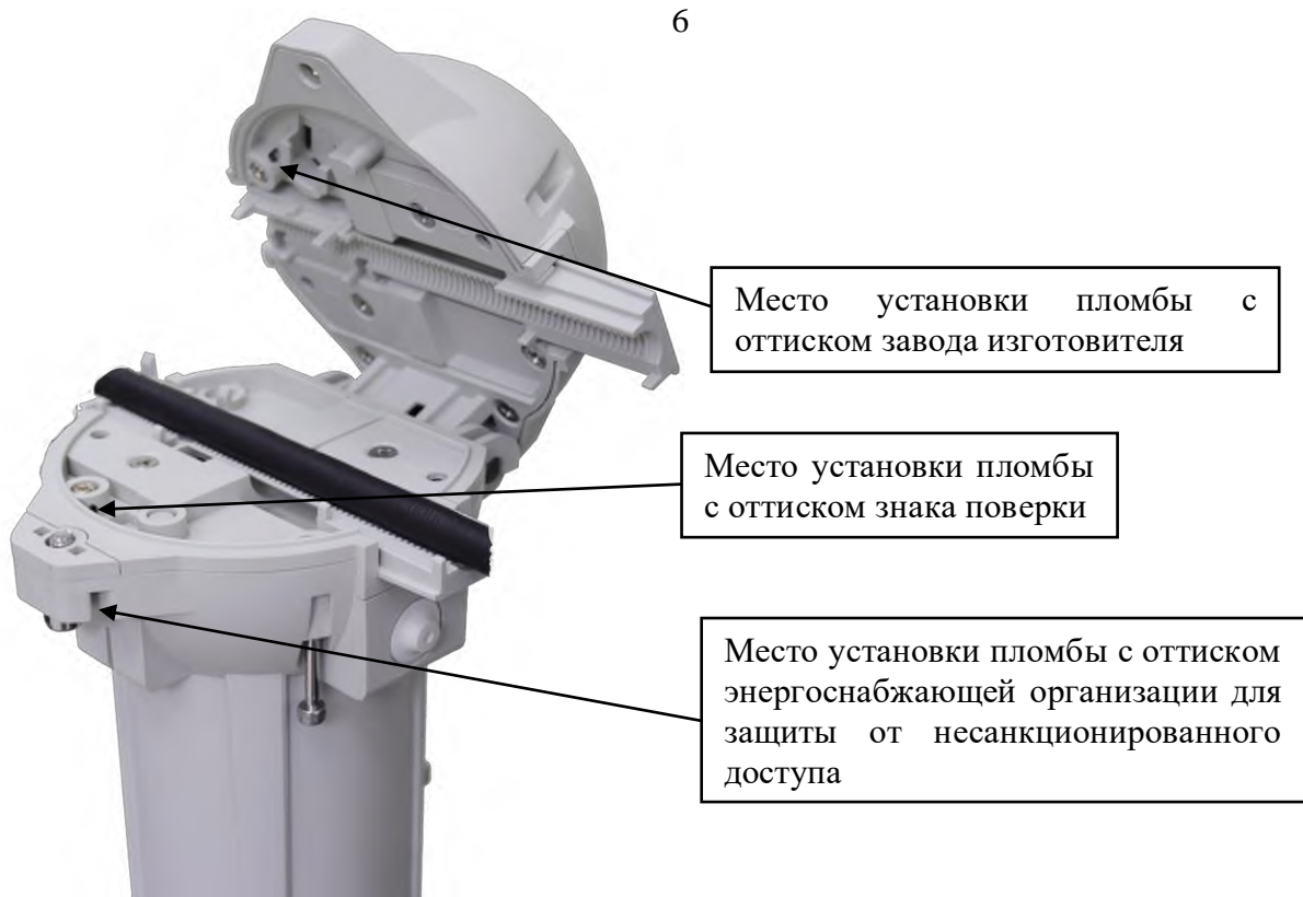
Рисунок 2 – Общий вид БС ВПУ в корпусе типа SPHV1 RGC2